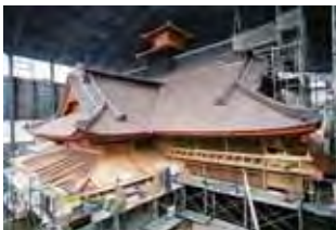
สำนักงานปกครองขณะก่อสร้าง (เดือนก.ค ปีเฮเซที่ 20)