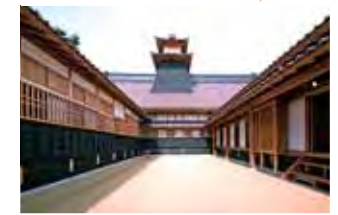
โทโตรีเมื่อมองขึ้นมาจากในสวนกลาง