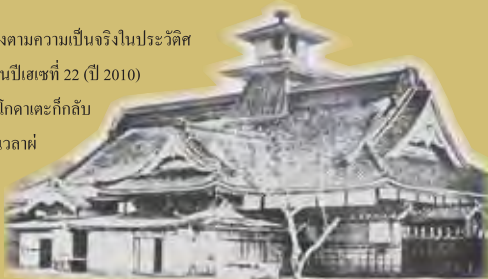
ภาพถ่ายในอดีตของสำนักงานปกครองฮาโกดาเตะ