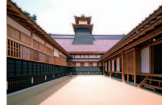
중정에서 올라다본 다이코 망루