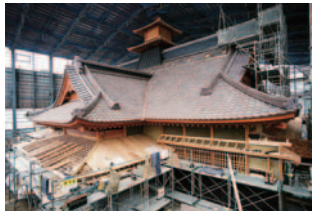
기와 지붕의 완성 (헤세 21년 4월)