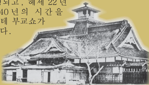
하코다테 부교쇼 고사진

하코다테시에서는 성곽 안의 건물이 손실되어 고료카쿠 본래의 모습을 이해하기 어려운 상황이 계속되고 있던 데서, 하코다테 부교쇼의 복원을 주로 한 고료카쿠의 사적 정비를 계획했습니다. 쇼와 60년 (1985)부터 발굴조사를 시작, 고사진이나 문헌자료 및 고도면 등의 조사를 기본으로 부교쇼 복원의 검토를 거듭해, 헤세 18년 (2006)부터 공사가 개시되었습니다. 이렇게 해서 역사적 사실에 충실한 복원이 진행되고, 헤세 22년 (2010)에 140년의 시간을 넘어 하코다테 부교쇼가 재현되었습니다.