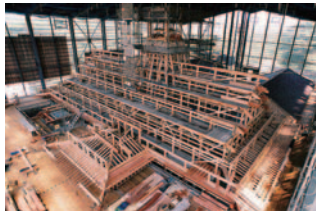
건축 도중의 부교쇼 (헤세 20년 7월)

하코다테 부교쇼의 복원 공사는 헤세 18년 (2006) 에 착공, 4년 후인 헤세 22년 (2010) 에 완성되었습니다. 복원 범위는 부교쇼 청사 전체의 대략 1/3에 해당하는 약 1,000㎡로, 전국에서 집결한 미야다이쿠 등 기술자에 의한 일본 전통 건축의 장인의 기술에 의해 당시의 모습이 재현되었습니다.