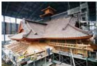
瓦葺きの完成 (平成 21 年 4 月)