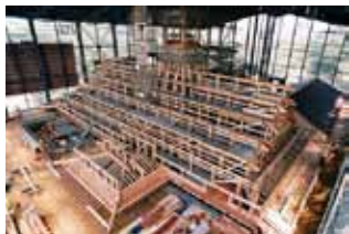
建築途中の奉行所 (平成 20 年 7 月)

箱館奉行所の復元工事は平成18年に着工し、4年後の平成22年に完成しました。復元範囲は奉行所庁舎全体のおよそ1/3にあたる約1,000㎡で、全国から結集した宮大工などの職人による日本伝統建築の匠の技により、当時の姿が再現されました。