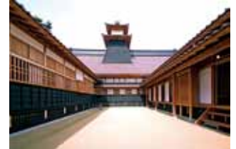
中庭から見上げる太鼓槽