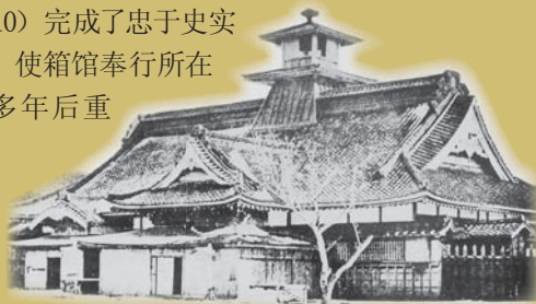
箱馆奉行所旧照

由于城郭内的建筑物已经不见踪影，导致五棱郭早已失去了本来的面目，故函馆市计划在函馆市内开始以箱馆奉行所为主的五棱郭史迹复原工作。昭和60年（1985）年起开始发掘调查，并在对旧照及文献资料、旧图纸等分析调查的前提下进行奉行所复原的相关研究，复原工程于平成18年（2006）正式动工，并于平成22年（2010）完成了忠于史实的复原建设，使箱馆奉行所在经历了140多年后重见天日。